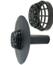
Dakafvoer Lengte: 240mm incl. bladvangertje Ø: 80mm / 100mm / 120mm ExtruBit®: zwart