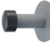
Verlichtingsschouw Hoogte: 225mm / 270mm Ø: 75mm - 100mm ExtruBit®: zwart ExtruPol®: lichtgrijs, wit, rood, groen