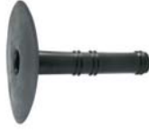
Dakafvoer voor bitumenbanen Lengte: 400mm Ø: 70mm / 110mm / 125mm ExtruBit®: zwart