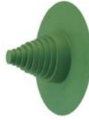
Universele dakdoorvoer Hoogte: 190mm Ø binnenkant: 40mm - 180mm ExtruBit®: zwart ExtruPol®: lichtgrijs, wit, rood, groen