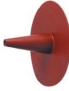
Spuwer Hoogte: 120mm / 190mm Ø binnenkant: 15mm - 40mm ExtruBit®: zwart ExtruPol®: lichtgrijs, wit, rood, groen