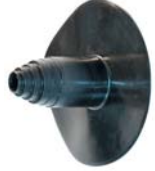
Aansluiting levenslijn Ø: 34mm / 93mm ExtruBit®: zwart ExtruPol®: lichtgrijs