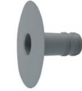
Dakafvoer Lengte: 250mm Ø: 70mm / 110mm / 125mm ExtruBit®: zwart ExtruPol®: lichtgrijs