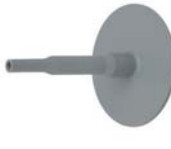
Dakdoorvoer voor bliksemafleider en elektrische leidingen Ø binnenkant: 10mm / 30mm ExtruBit®: zwart ExtruPol®: lichtgrijs