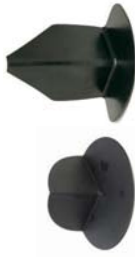
Buitenhoek Hoogte: 100mm / 170mm ExtruBit®: zwart ExtruPol®: lichtgrijs, wit, rood, groen, blauw

Het is aangenaam werken met de voorgevormde ExtruBit® en ExtruPol® hulpstukken. Alle hulpstukken zijn verkrijgbaar in de courante kleuren. Op deze manier plaatst u een homogeen en esthetisch dak.