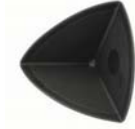
Binnenhoek Hoogte: 95mm / 170mm ExtruBit®: zwart ExtruPol®: lichtgrijs, wit, rood, groen